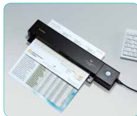
Alimentatore documenti da 10 fogli, con scansione fronte-retro

Anche gli utenti domestici si troveranno bene con lo scanner P-208II, la soluzione ideale per sottoporre a scansione le bollette di casa, mentre la funzionalità Picture Mode è ideale per digitalizzare vecchie foto in modo accurato.