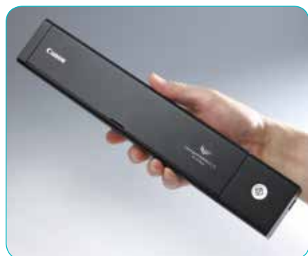
Ultrasottile e superleggero